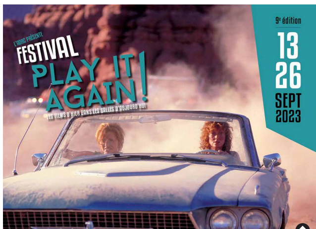
Thelma et Louise de Ridley Scott