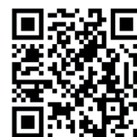
Sébastien MICHEL , Maire d'Écully