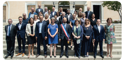
Élection du conseil municipal en juillet 2020