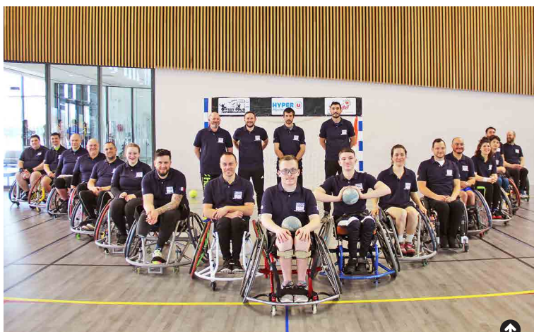
L'équipe Elite France est venue s'entraîner à Écully fin mars.

Écully est fière d'accueillir les 1 er et 2 juillet au Centre sportif et de Loisirs, un événement d'envergure dans le monde du handisport : le 1 er tournoi européen de hand fauteuil en France. Outre la première apparition de l'équipe Elite France, ce tournoi comptera la participation du Portugal (champion d'Europe 2018), de l'Espagne et de la Belgique.