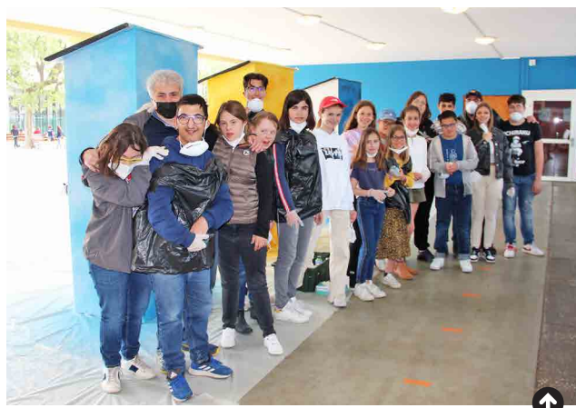
Les jeunes réunis pour la peinture des boîtes.

La médiathèque a fourni un fonds d'ouvrages, mais c'est maintenant à vous de faire vivre ces boîtes en venant prendre des livres, les ramener et/ou en déposer d'autres (romans, revues, albums jeunesse, BD, manga... en bon état). On compte sur vous !