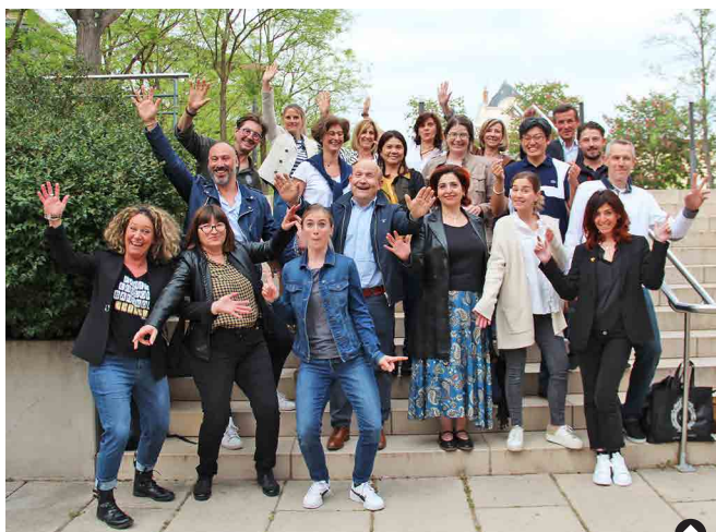
Une partie des dynamiques membres de l'association.