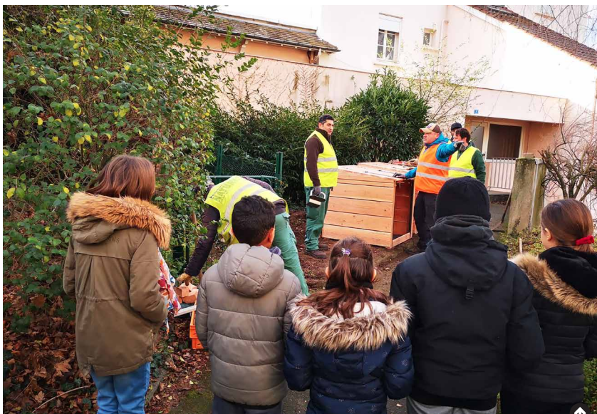
Lors de l'installation des bacs à l'école du Centre.

Les trois dernières écoles publiques, Grandvaux, Centre et Charrière Blanche ont été dotées de bac à compost. L'équipe éducative et les enfants ont été formés au tri des déchets au niveau de la restauration scolaire et alimentent dorénavant les composteurs.