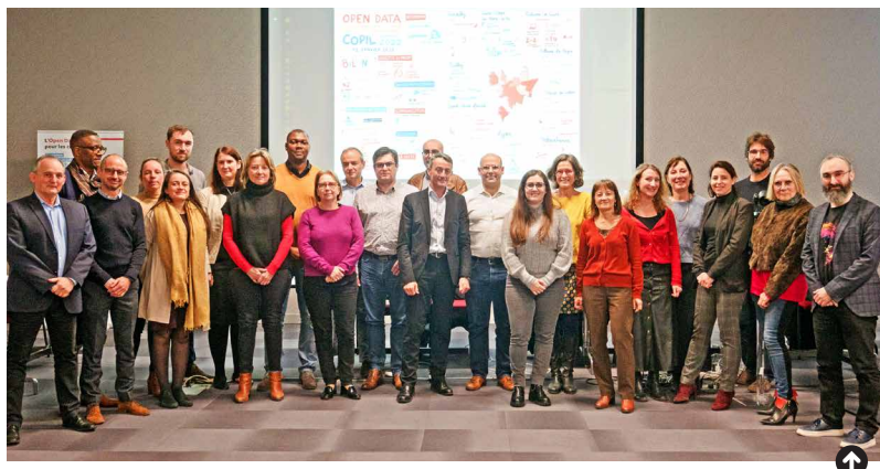
Les acteurs de l'Open data des communes lors du comité de pilotage de janvier dernier.

La démarche d'Open data consiste à publier des données libres, gratuites et réutilisables par tous, pour une plus grande transparence de l'action publique. Une démarche qui répond d'ailleurs à une obligation de la Loi pour une République numérique de 2016 pour les communes de plus de 3500 habitants.