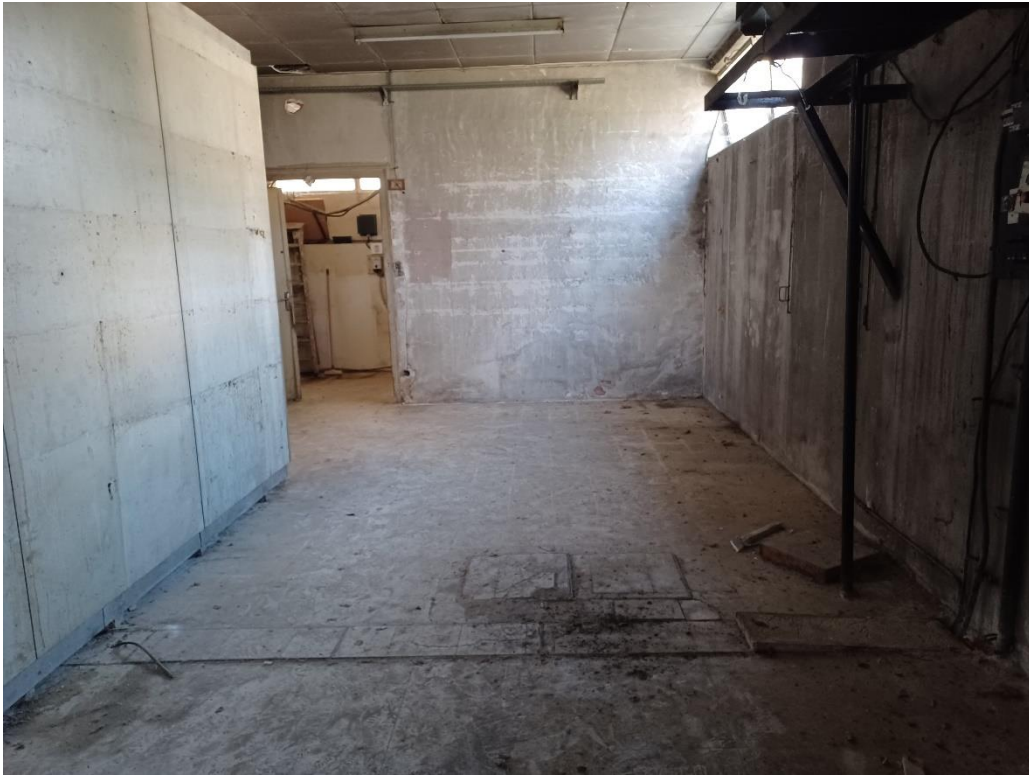
Vue de la zone réserve