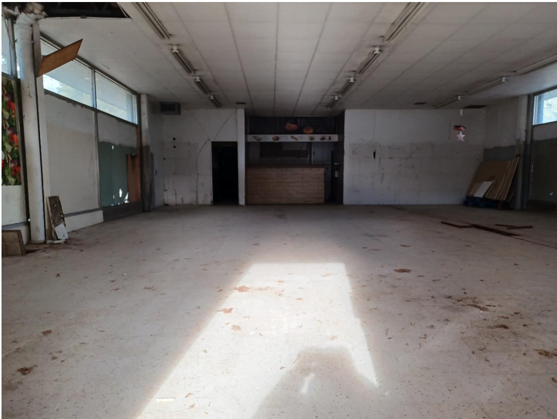
Vue intérieure à partie de la porte d'entrée