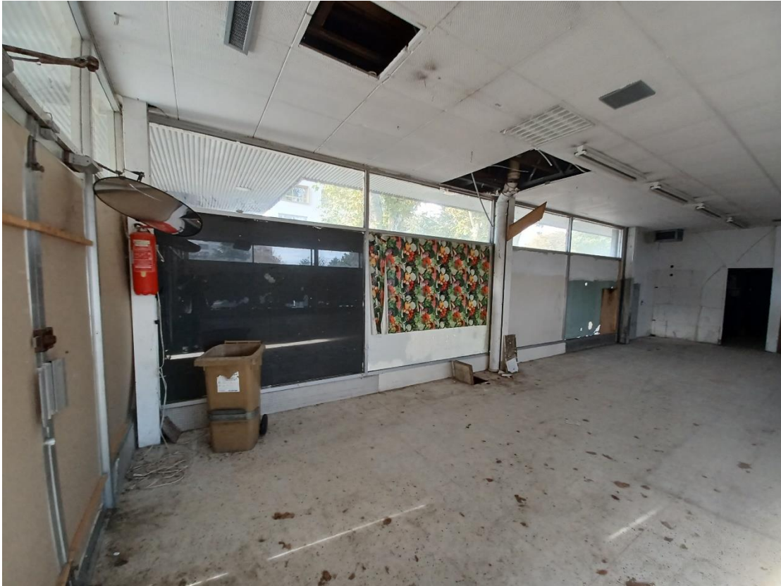
Vue intérieure – porte d'entrée